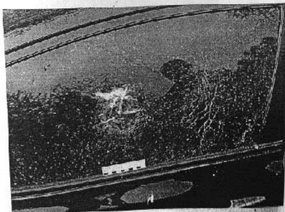
Гильза № 5: Автомобиль «Жинда - Цинко», принадлежащий Пустовому А.А. Повреждение на заднем заднем стекле. Вид снаружи.

Составляет: A hand-drawn diagram of a car's rear window area. A circle is drawn around a specific spot on the window, likely indicating the location of the damage mentioned in the caption.